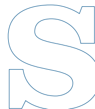
Gli hotel sull'acqua più spettacolari del mondo