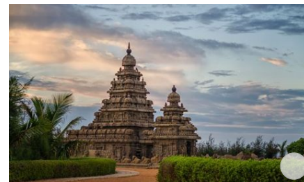
India: 10 templi da scoprire per ritrovare se stessi

presentate con un allestimento astratto che valorizza le brillanti policromie e il valore espressivo delle statue. Una preziosa cornice in ebano e filigrana d'argento racchiude uno dei presepi più piccoli al mondo, quello del Museo dell'Accademia Linguistica di Belle Arti , con le misure minuscoli di 84x62x16 millimetri. Tra uno spettacolo teatrale ed una rappresentazione operistica trova spazio anche Circumnavigando, Festival Internazionale di Teatro e Circo Contemporaneo, in programma fino al 10 gennaio: spettacoli che riuniscono le migliori discipline circensi in una commistione di generi, stili, nuove arti e nuovi artisti che si esibiscono in strada, nei teatri, nei palazzi cittadini e nel tendone al Porto Antico.